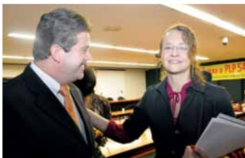
Ex-deputada Luciana Genro: “Esse PLP significa retrocesso para o serviço público”