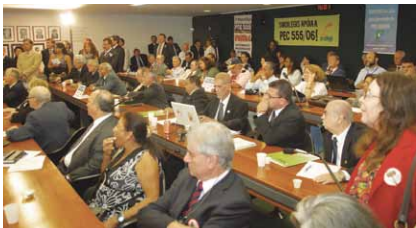
Representantes de entidades e servidores acompanharam a votação da PEC 555

A PEC 555/2006 prevê a extinção da cobrança previdenciária de aposentados e pensionistas do serviço público, instituída pela famigerada Reforma da Previdência em 2003. Aprovada pela comissão especial com alteração do texto original, desde o mês de julho aguarda inserção na pauta do Plenário da Câmara, onde deve ser votada em dois tur-