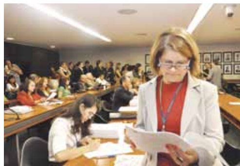
Diretora de aposentados e pensionistas acompanha a tramitação da proposta

O parecer aprovado pela comissão especial permite a integralidade e a paridade remuneratória dos servidores