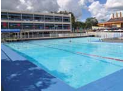
Piscina olímpica do Centro de Assistência Social